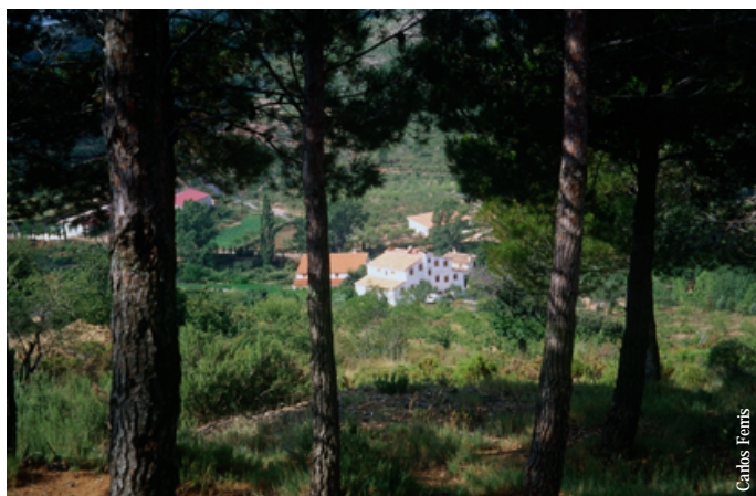
el Mas de Noguera, Caudiel