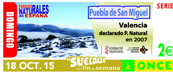
Imagen 1. Cupón de la ONCE del PN Puebla de San Miguel