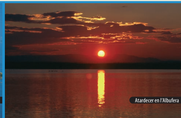
Atardecer en l'Albufera