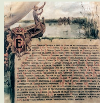
Documento de la Cesión

El Lago de l'Albufera y su Devesa pertenecieron al patrimonio real desde el año 1238 (año en el que Jaime I, al conquistar Valencia, se reserva para él la propiedad de ambos espacios), hasta 1869 en el que pasó a patrimonio del Estado. A partir de 1905 el Ayuntamiento de Valencia inicia las gestiones para conseguir del Estado la cesión del lago y su Devesa. En 1911 se decreta la Ley de