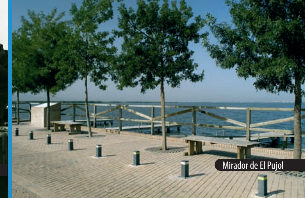
Mirador de El Pujol