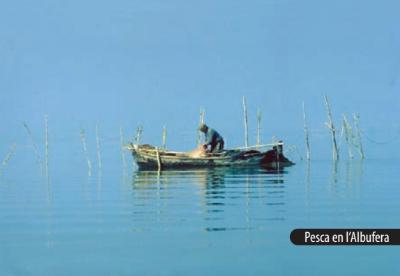
Pesca en l'Albufera