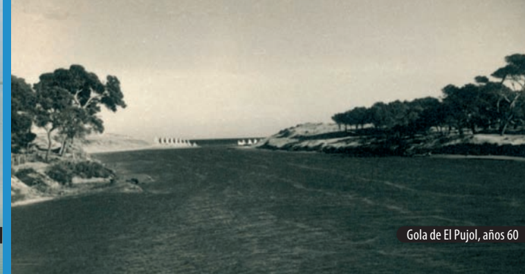
Gola de El Pujol, años 60