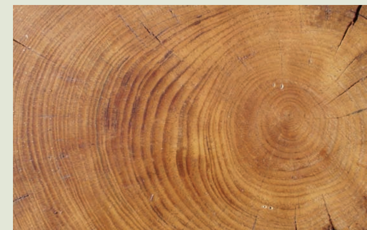
Anillos del tronco de un árbol

Desde esta parada podemos enlazar con el itinerario botánico o seguir recto hasta el mirador de El Pujol desde donde podemos ver l'Albufera.