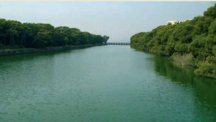
Gola de El Pujol

El humedal del Parque Natural de l'Albufera se comunica con el mar a través de cinco golas o canales. Tres de ellas (la Gola de El Pujol, la de El Perellonet y la de El Perelló) comunican el lago de l'Albufera con el mar. Las otras dos (la Gola del Rei o del Mareny y la de Sant Llorenç o del Cano de Cullera), evacúan las aguas de la marjal de Sueca y Cullera.