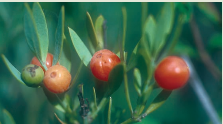
Frutos del bayón

Mirando el cielo veremos pasar gaviotas, garzas, charranes, un bando de gorriones o jilgueros. Bajando un poco la vista veremos los distintos estratos de la vegetación: hierbas, arbustos y árboles. Cuanto más hacia abajo miremos más variedad de plantas encontramos aunque la presencia de enredaderas, como la Madreselva y la Zarparrilla, que trepan por los arbustos y los árboles, dan la sensación de formar un todo.