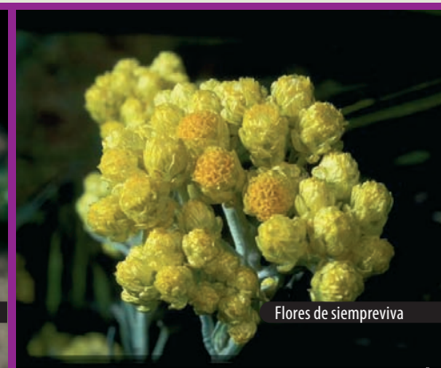
Flores de siempreviva