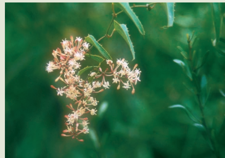
Flores de la zarzaparrilla