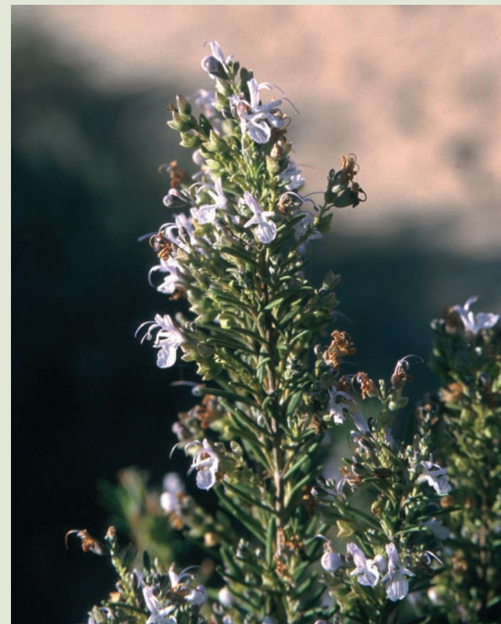
Flores del romero

Después de llover, pasear por la Devesa es una experiencia muy gratificante, por el agradable olor que desprende la tierra mojada. Con la lluvia se agudizan todos y cada uno de los olores propios de plantas y flores de la zona.