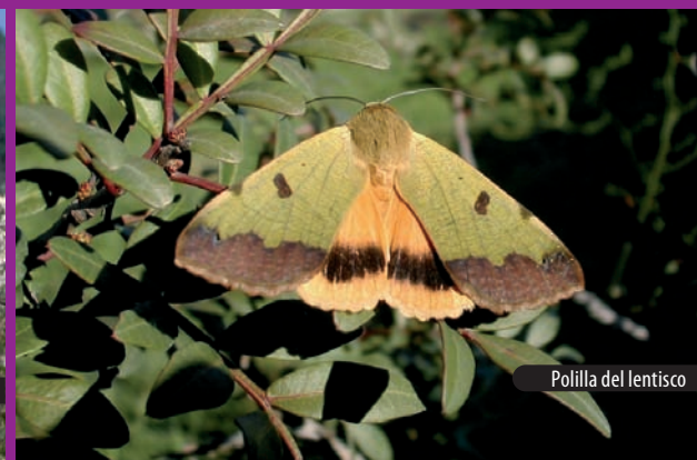
Pollina del lentisco