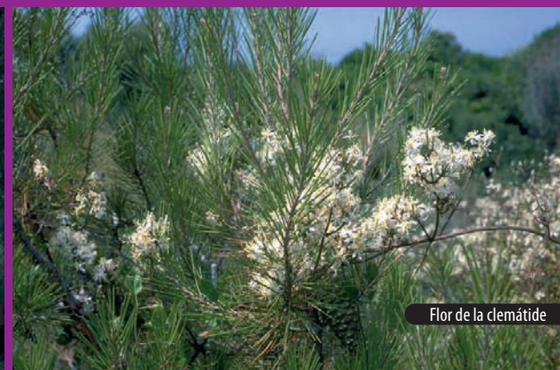
Flor de la clemátide