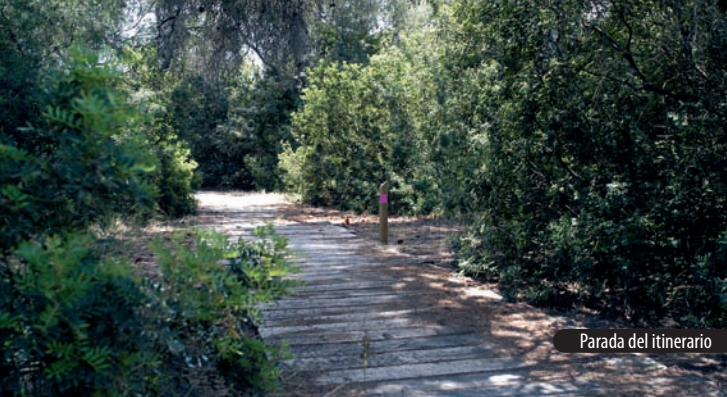
Parada del itinerario