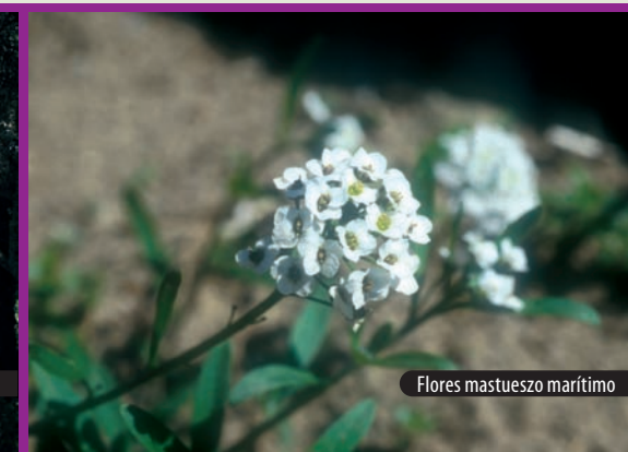
Flores mastuerzo marítimo