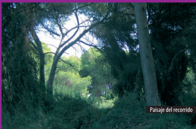
Paisaje del recorrido