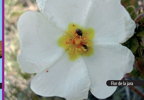
Flor de la jara