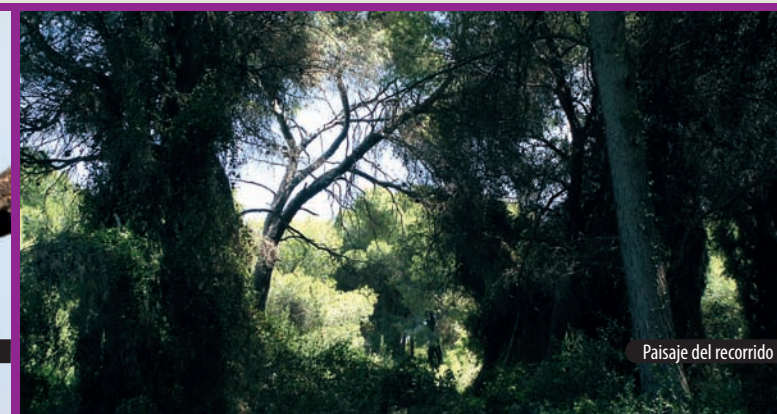
Paisaje del recorrido