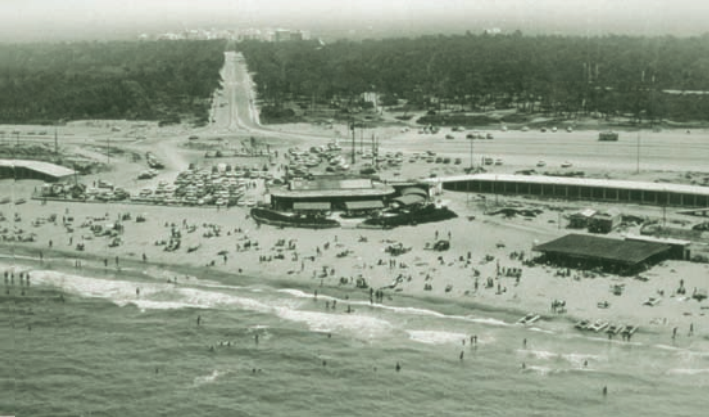
Paseo de El Saler, 1970

El antiguo ecosistema de dunas de primera línea que caracterizaba la playa de El Saler fue arrasado a finales de los años sesenta para construir un paseo marítimo elevado sobre el nivel del mar, con restaurantes y duchas en la parte baja. Este paseo marítimo, se eliminó a finales de los años noventa y se sustituyó por un cordón de dunas y por el actual paseo por el que discurre el itinerario. El nuevo paseo al estar construido al nivel del mar y estar situado detrás de las dunas, produce un menor impacto.