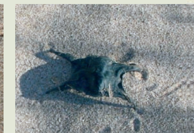
Huevo de tiburón