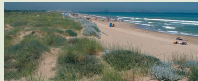
Vista de la playa de El Saler

Si el recorrido lo hacemos en verano y miramos hacia la playa veremos familias, parejas, y grupos de amigos, todos juntos, bañándose o tomando el sol. Esto que hoy nos parece tan normal no ha sido siempre así.