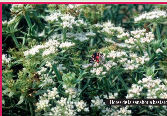
Flores de la zanahoria bastarda