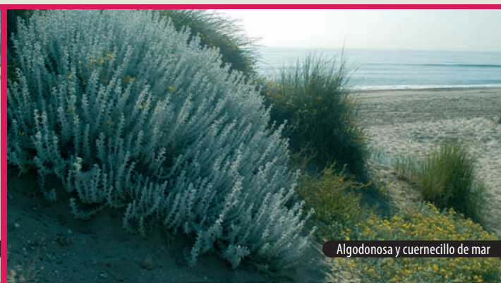
Algodonosa y cuernecillo de mar