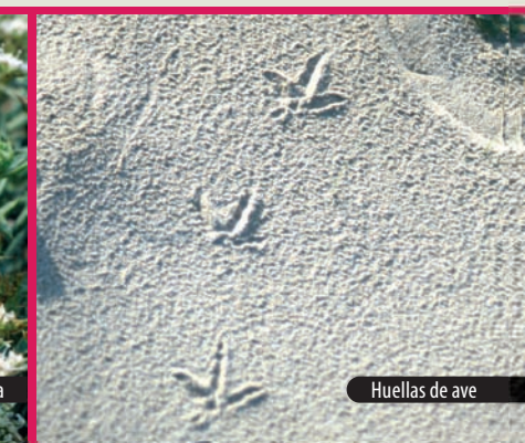
Huellas de ave