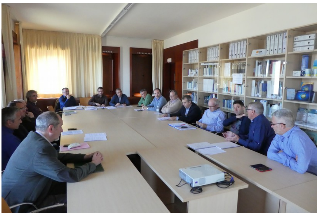
Reunión del Consell de Protecció 07.04.2017 a la sala de juntas del CEMA Font Roja

Director-Conservador Presidente del Consell de Protecció Equipo Técnico y de Promoción y divulgación