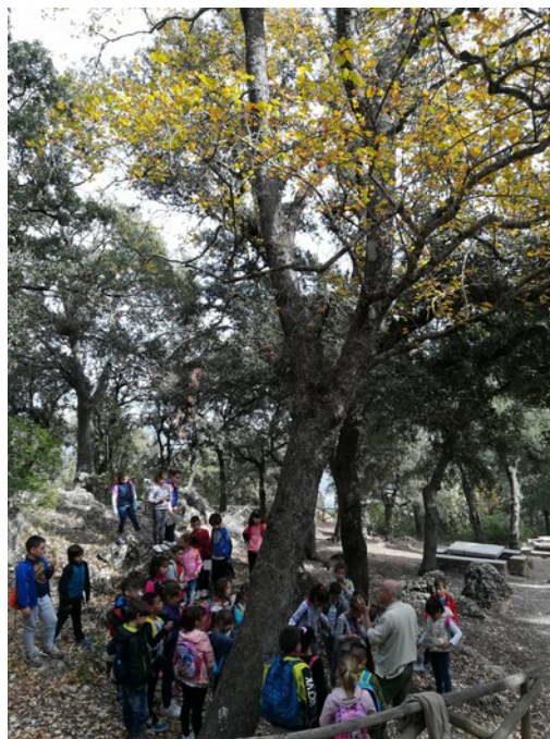
Centro escolar con servicio de acogida por el Equipo de Promoción