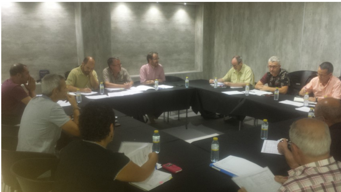
Reunión de la Comisión Científica al Museo de la Biodiversidad (Ibi), 29.06.2017

2 reuniones anuales: 26/06/2017 y 20/10/2017