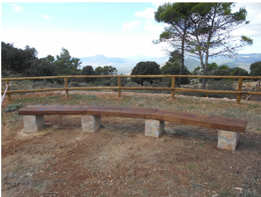
Detalle del nuevo banco de madera instalado en el área del Mas de Tetuan

Material de construcción y obra aportado por el Ayuntamiento de Alcoi