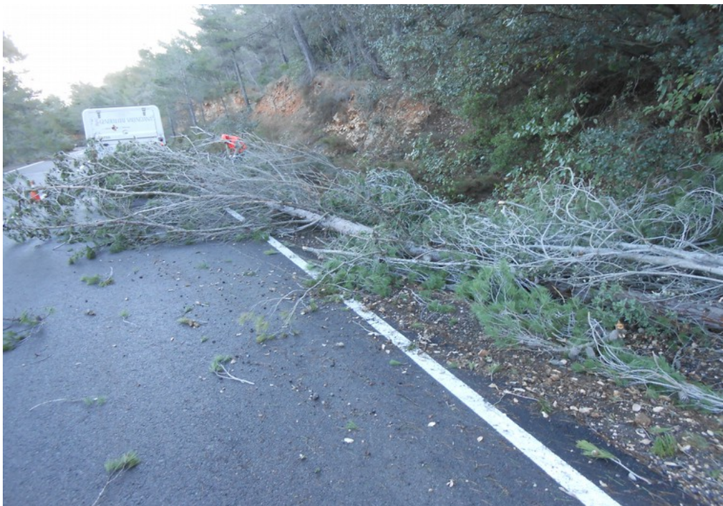
Actuación de retirada de pino blanco ( Pinus halepensis ) a la carretera afectados por los temporales de nieve

Brigada de Conservación y Mantenimiento del Parque Natural y Brigada Forestal contratada por VAERSA