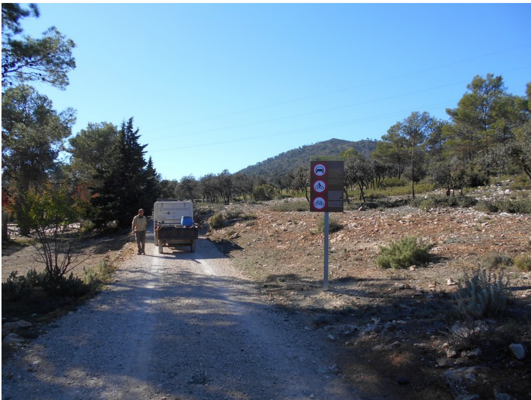
Señalización de prohibición de tránsito de vehículos por pistas forestales

Brigada de Conservación y Mantenimiento del Parque Natural, con la colaboración de los Ayuntamientos de Alcoi e Ibi