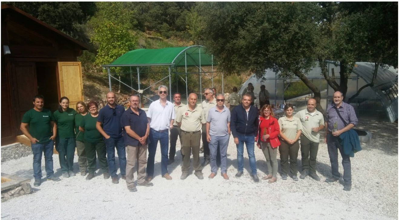
Inauguración de las nuevas instalaciones del vivero forestal Fuente Roja, 01/10/2017,

Colabora Brigada de Conservación y Mantenimiento, Ayuntamiento de Alcoi y Equipo Técnico del Parque Natural