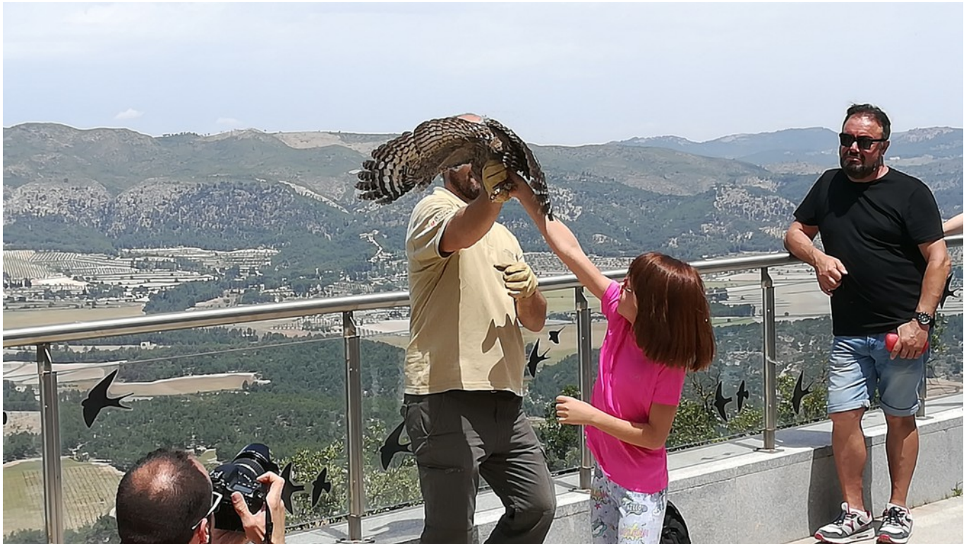
Suelta popular de rapaces para celebrar el Día Mundial del Medio Ambiente a la Font Roja