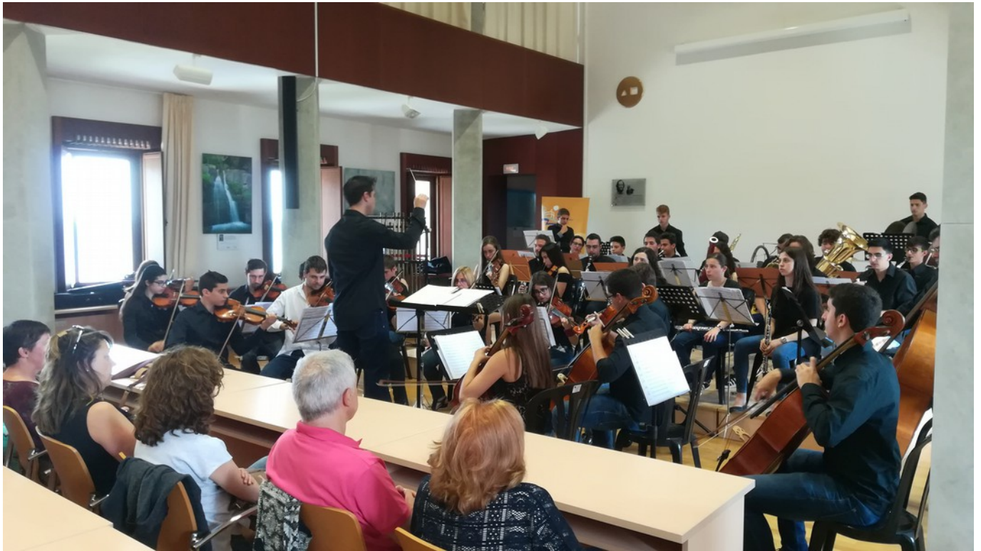
Concierto de música “la Font Roja de cine” con motivo del Día Mundial del Medio Ambiente