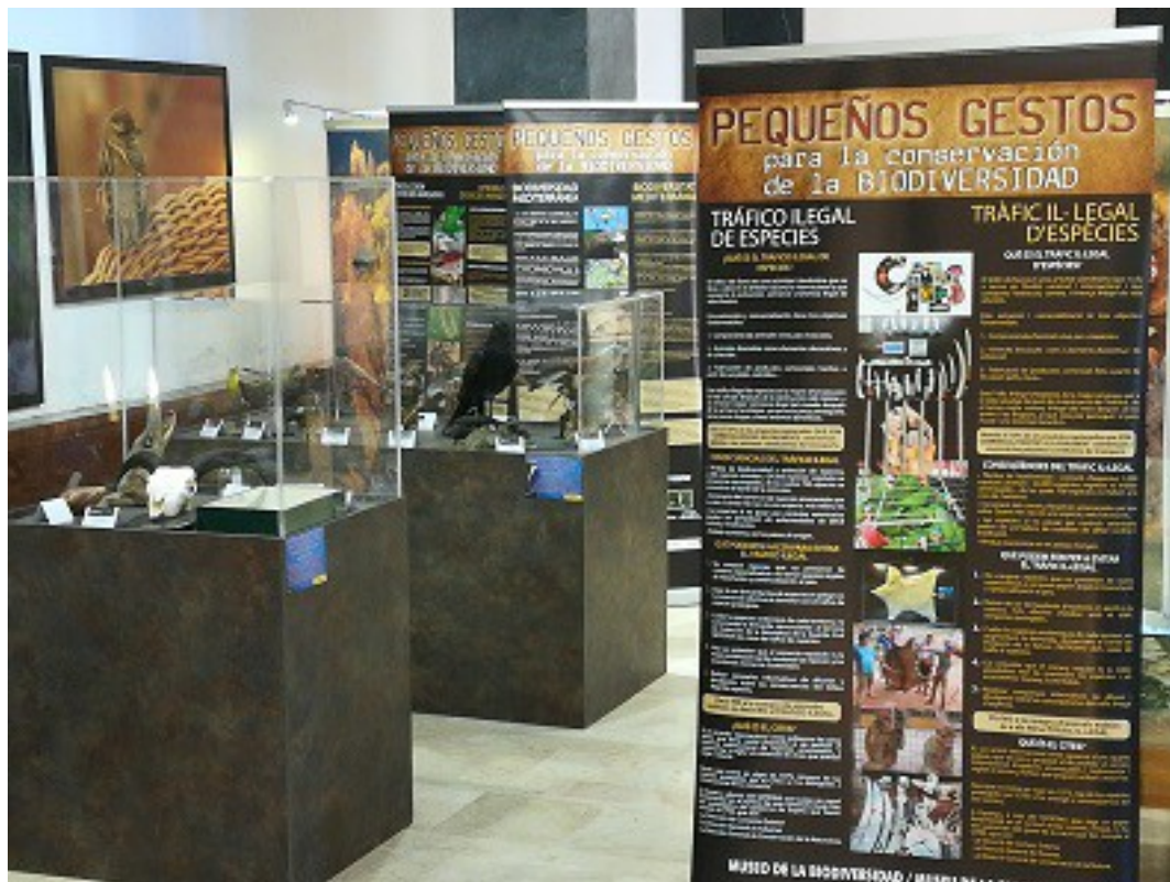
Exposición sobre “Pequeños gestos para la conservación de la Biodiversidad”

Equipo de Promoción del Parque Natural, colaboración de las entidades que exponen.