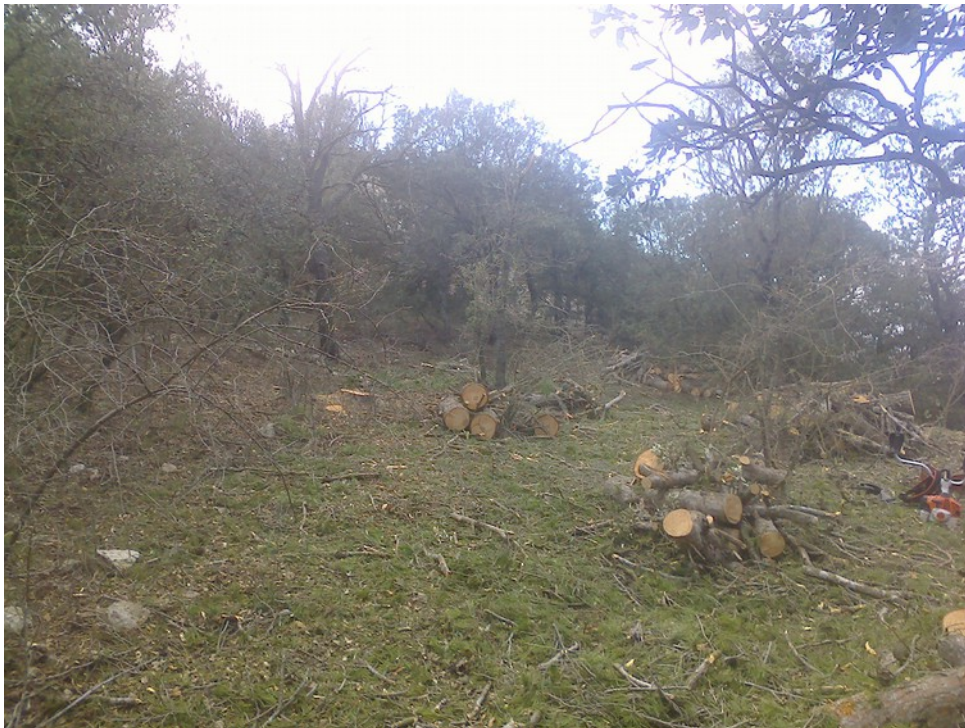
Retirada selectiva de pins ( Pinus halepensis ) en l'ombria del Carrascal

Brigada de Conservación y Mantenimiento del Parque Natural