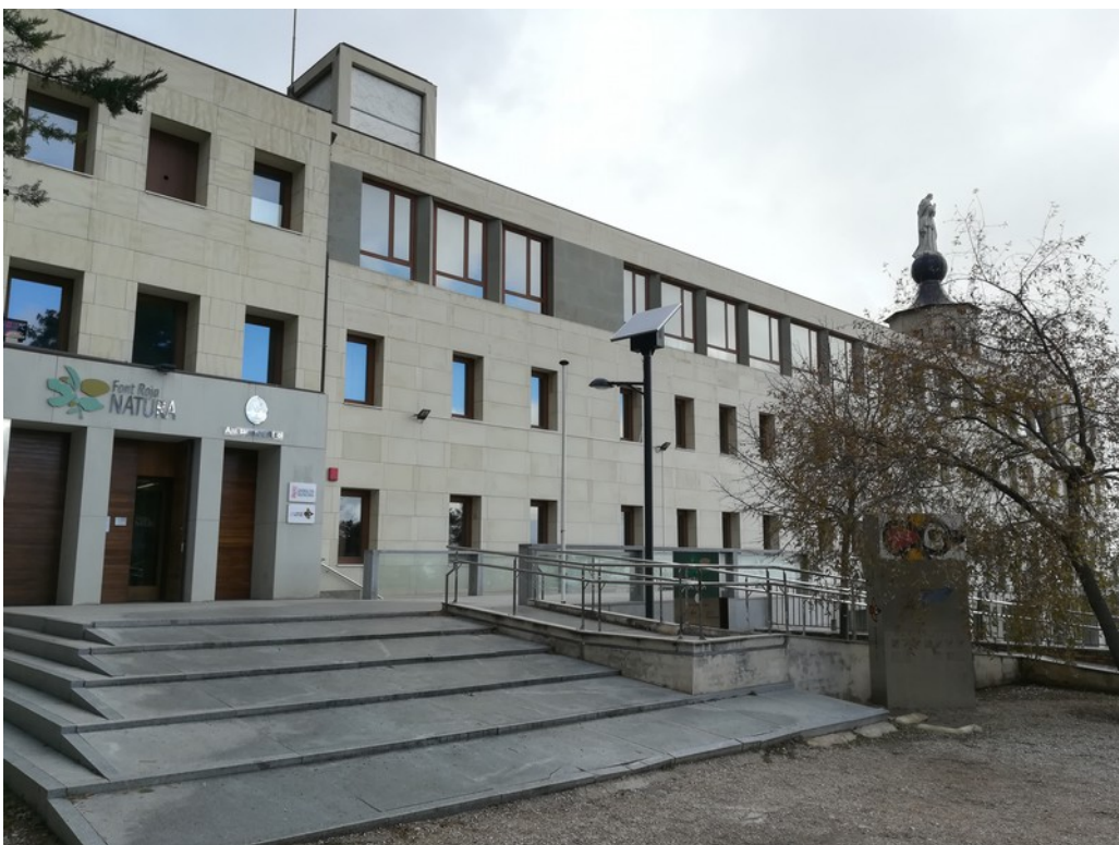
Centro de Visitantes alberga las oficinas técnicas adscritas a la gestión del Parque Natural