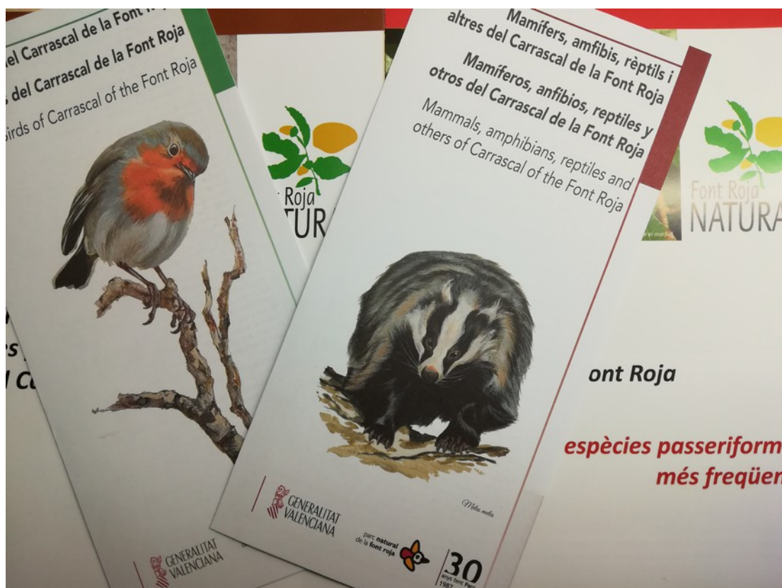
Material divulgativo publicado sobre fauna del Parque Natural de la Font Roja

Equipo Técnico y Equipo de Promoción, con la colaboración de la Estación Científica Font Roja –Universidad de Alicante, con la financiación por el proyecto FECYT