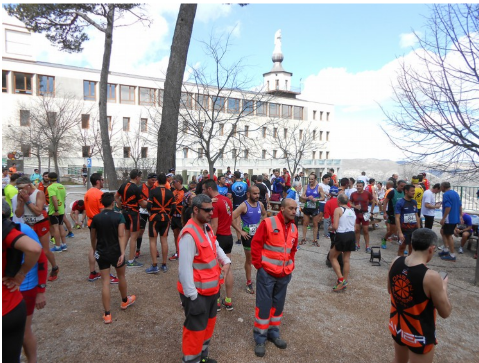
Popular carrera de atletismo "Pujada a la Font Roja"

Equipo Técnico y equipo de Promoción del Parque Natural, colaboran entidades organizadoras