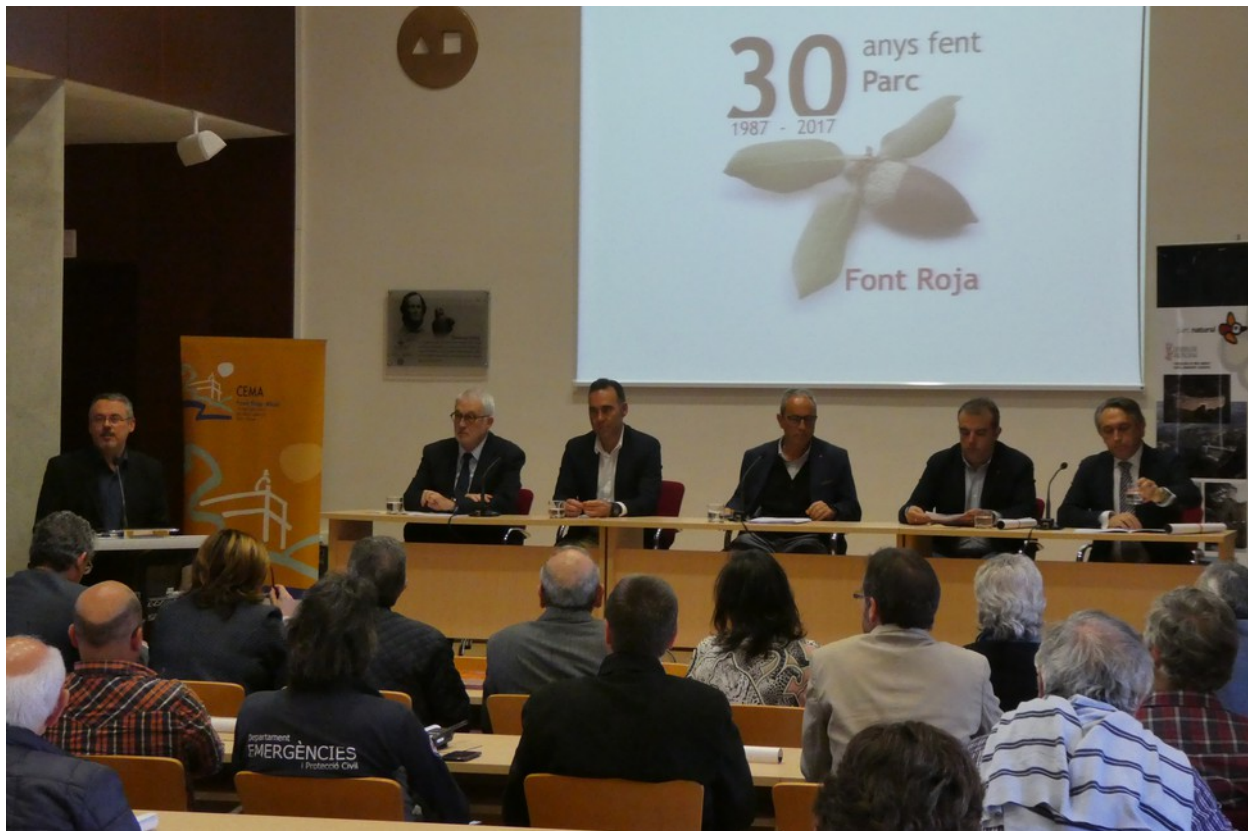
Acto institucional de celebración del 30 aniversario del Parque Natural de la Font Roja, 07.04.2017, con presencia de las diferentes autoridades.

Logotipo creado para destacar las actuaciones realizadas en el 30 Aniversario del Parque Natural