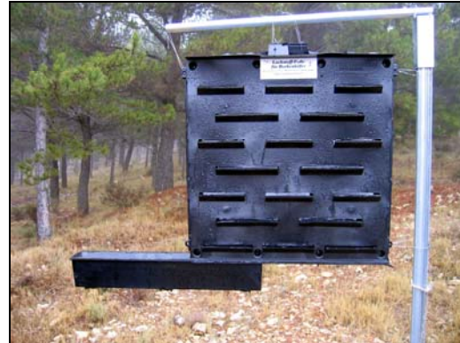
Foto 4. Trampa Theysohn

colocado 4 trampas cebadas con feromona separadas entre sí 500 metros siguiendo la metodología de colocación de las trampas facilitada por el Laboratorio de Sanidad Forestal de Mora de Rubielos y el Servicio de Protección de los Montes contra los Agentes Nocivos.