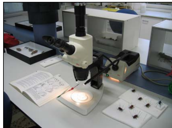
Foto. 1.- Lupa triocular del laboratorio de Sanidad Forestal (CIEF).

Plegaderes otti Aulonium ruficorne Hylaster ater Orthotomicus erosus Fam. Cossoninae Dryomia lichtensteini Haematoloma dorsatum Cryptolaemus montrouzieri Hylurgus ligniperda Hylurgus micklitzii Tomicus piniperda Thaumatomyia notata Erannis defoliaria Ips sexdentatus Ips acuminatus Orthotomicus longicollis Cinara sp. Eulachnus sp. Scolytus kirschii Dactilopius opuntiae Ips mansfeldi Tomicus destruens Tomicus minor