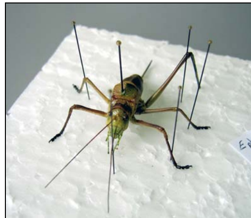
Foto 8. Steropleurus stalii capturado en trampas de feromonas para procesionaria.

Durante la recogida de las trampas tipo "G" colocadas en los pinares para la captura de mariposas de procesionaria ( Thaumetopoea pytiocampa Schiff.) en la Comunitat Valenciana, es frecuente la observación de ortópteros que entran en las bolsas a devorar las mariposas macho capturadas con atrayentes feromonales. Debido a que se recogen todas las trampas colocadas durante la temporada (durante el año 2008 se colocaron 4577 trampas en toda la Comunitat Valenciana), se ha incorporado a la recogida la tarea de capturar los ortópteros que apareciesen en las cajas para su estudio e identificación. El objetivo de este trabajo es el de determinar la fauna de ortópteros que se nutre del estado adulto del mencionado lepidóptero defoliador del pino, capturada en las trampas tipo "G" colocadas en los pinares de la Comunitat Valenciana. Asimismo, se pretende representar su distribución en la Comunitat. Este trabajo ya fue iniciado en la campaña de 2005.