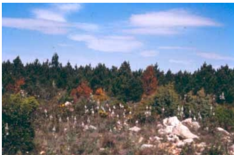
Fotografía 1: Pinos rodenos ( Pinus pinaster ) muertos en el monte Muela de Cortes. En algún caso se detectaron larvas de Matsucoccus feytaudi .

Realizando un seguimiento de los ciclos biológicos de Tomicus piniperda y Pissodes notatus , se localizó sobre una de las trozas estudiadas la cochinilla del pino pinaster, Matsucoccus feytaudi Duc.,