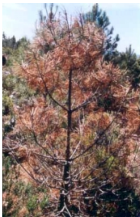
Fotografía 2: Pino rodeno muerto con cámaras de pupación de Pissodes notatus en el monte Muela de Cortes.