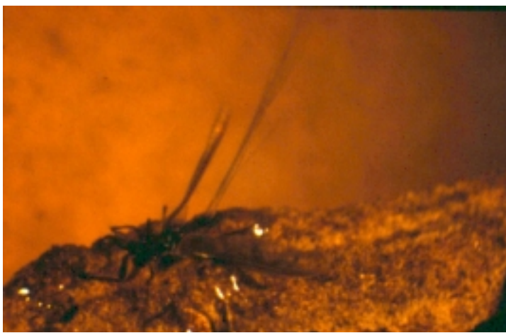
Fotografía 4: Macho adulto de Matsucoccus feytaudi .

de debilitamiento del pino rodano, extendiéndose a la práctica de las comarcas en las que existen masas de Pinus pinaster , aunque todavía se encuentra por establecer la presencia de la cochinilla en ellas.