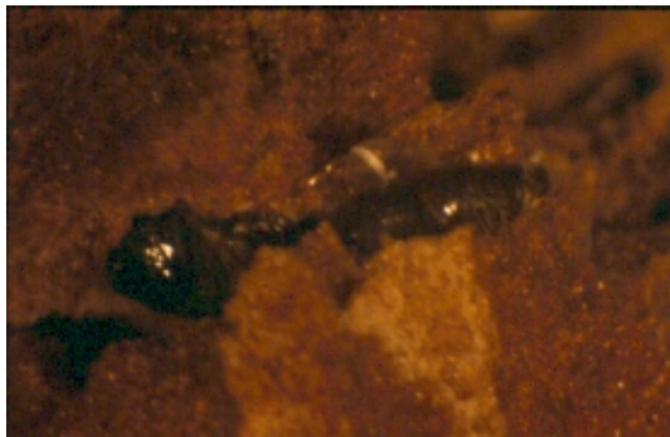
Fotografía 5: Larvas de segundo estadio en una grieta de la corteza de Pinus pinaster .

Su diminuto tamaño en todos sus estadios (en una buena parte de las fases la talla no supera los 1 ó 1,5 mm) y el hecho de que una buena parte de su vida la desarrolle oculto entre la corteza hacen que su existencia en el monte pase desapercibida para gestores y estudiosos de plagas forestales. Incluso para su búsqueda específica conviene seleccionar los periodos en los que es más fácilmente reconocible, como pueden ser el final del otoño y el invierno.