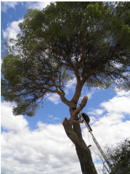
Trabajos de modificación de la copa para reducir el riesgo de vuelco.