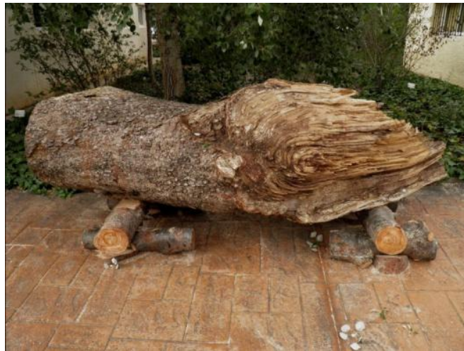
Una troza del brazo roto se incorpora a una exposición temporal en el CIEF.