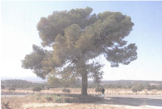
Árbol completo (2009).