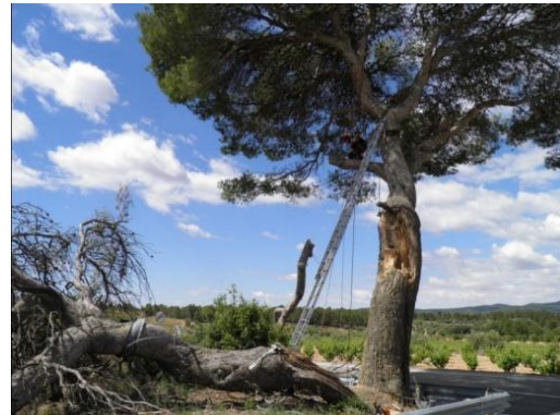
Brazo caído (05/2014).