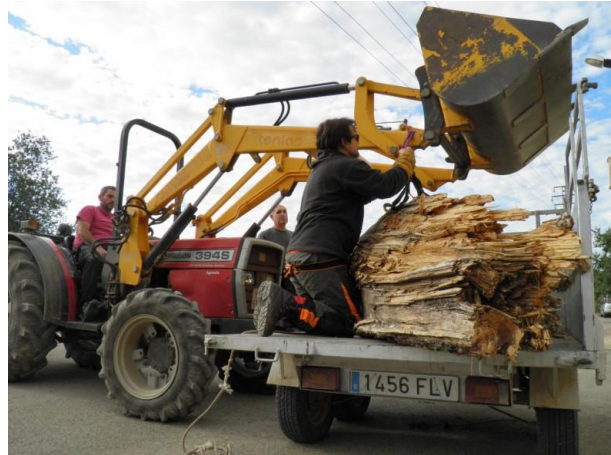
Transporte de un tocón del brazo desgarrado.