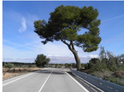
Tras la pérdida del brazo, la copa restante quedaba peligrosamente inclinada sobre la carretera de Jaraguas.