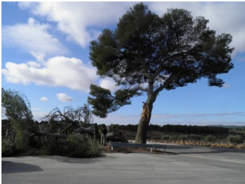
Brazo caído (03/2014).