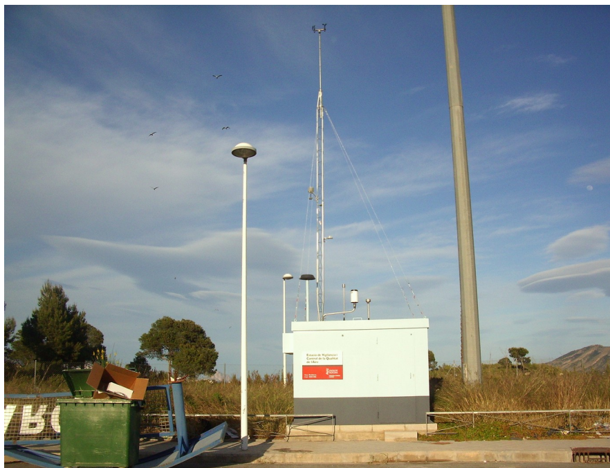
Foto: Estación de BENIDORM

En algunas estaciones se dispone además de sensores para diferentes parámetros meteorológicos, como velocidad y dirección del viento, humedad relativa, radiación solar, presión atmosférica y precipitación. Estos parámetros son útiles para la interpretación de los datos y el conocimiento de la dinámica de los contaminantes en el seno de la atmósfera.