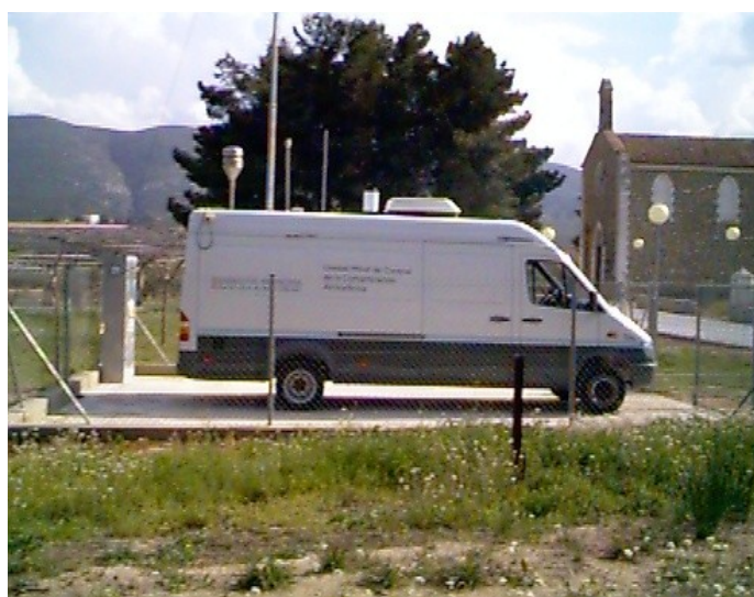
Foto: Unidad Móvil de Ontinyent

La Red Valenciana de Vigilancia y Control de la Contaminación Atmosférica cuenta con tres unidades móviles y una Unidad de Intervención Rápida, las cuales, obtienen información sobre 9 emplazamientos repartidos en el área interior de la Comunidad Valenciana