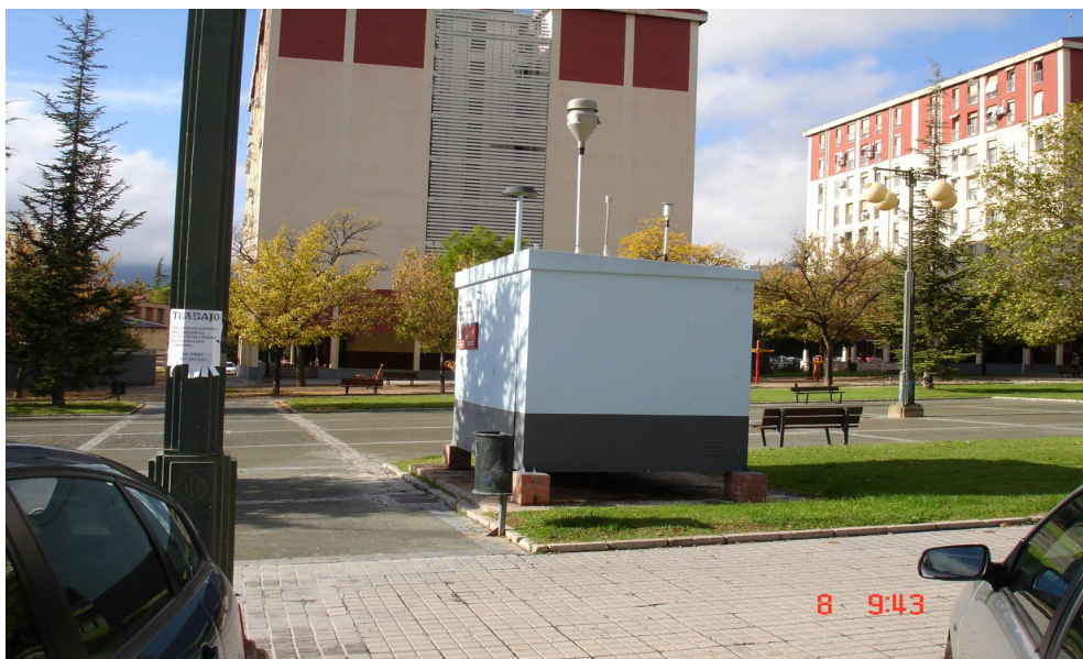
Foto: Estación de ALCOI-VERGE DELS LLIRIS

En algunas estaciones se dispone además de sensores para diferentes parámetros meteorológicos, como velocidad y dirección del viento, humedad relativa, radiación solar, presión atmosférica y precipitación. Estos parámetros son útiles para la interpretación de los datos y el conocimiento de la dinámica de los contaminantes en el seno de la atmósfera.