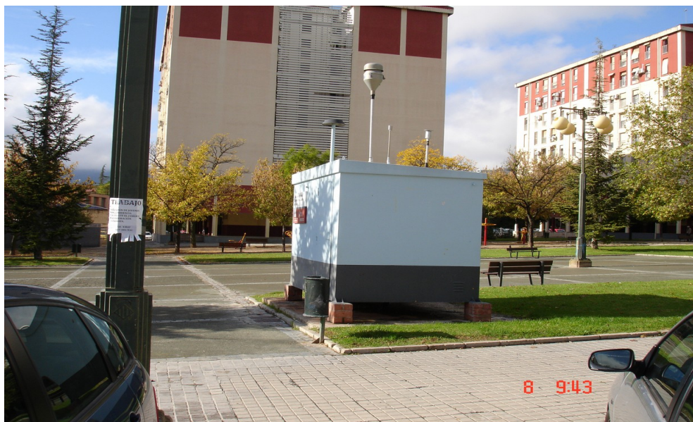
Foto: Estació a ALCOI-VERGE DELS LLIRIS

En algunes estacions es disposa a més, de sensors per a diferents paràmetres meteorològics, com la velocitat i la direcció del vent, la humitat relativa, la radiació solar, la pressió atmosfèrica i la precipitació. Aquests paràmetres són útils per a la interpretació de les dades i el coneixement de la dinàmica dels contaminants en el si de l'atmosfera.