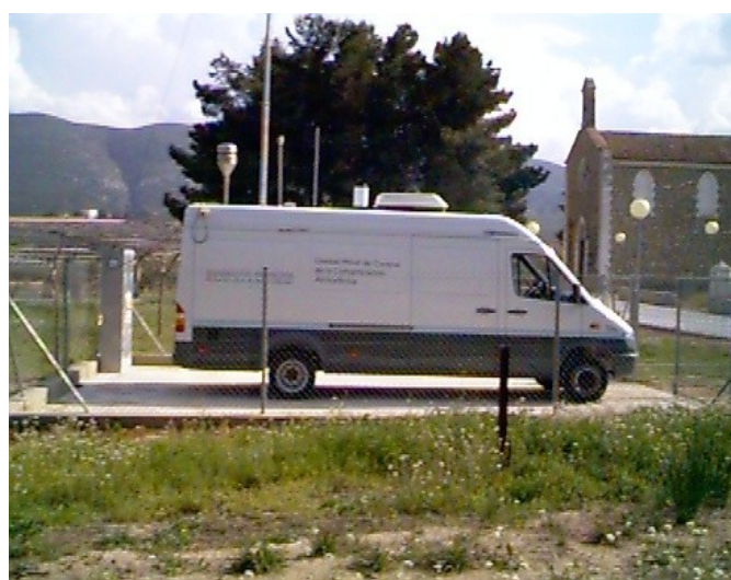
Unitat mòbil a ONTINYENT

La Xarxa Valenciana de Vigilància i Control de la Contaminació Atmosfèrica compta amb tres unitats mòbils i una Unitat d'Intervenció Ràpida, les quals, obtenen informació sobre nou emplaçaments repartits en l'àrea interior de la Comunitat Valenciana.