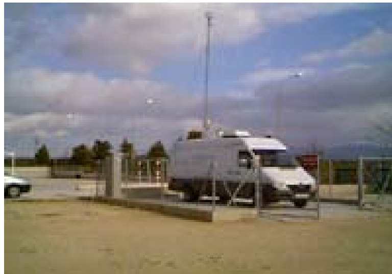
Foto: Unitat mòbil a Benigànim.

La Xarxa Valenciana de Vigilància i Control de la Contaminació Atmosfèrica compta amb tres unitats mòbils i una Unitat d'Intervenció Ràpida, les quals, obtenen informació sobre nou emplaçaments repartits en l'àrea interior de la Comunitat Valenciana.