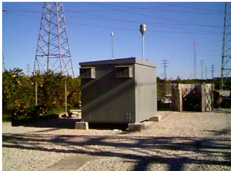
Foto: Estación de ALZIRA

En algunas estaciones se dispone además de sensores para diferentes parámetros meteorológicos, como velocidad y dirección del viento, humedad relativa, radiación solar, presión atmosférica y precipitación. Estos parámetros son útiles para la interpretación de los datos y el conocimiento de la dinámica de los contaminantes en el seno de la atmósfera.