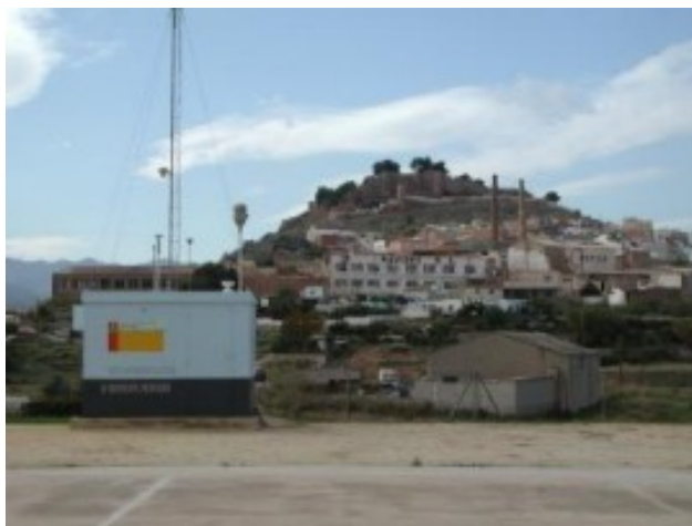
Foto: Estació a ONDA

En algunes estacions es disposa a més, de sensors per a diferents paràmetres meteorològics, com a la velocitat i la direcció del vent, la humitat relativa, la radiació solar, la pressió atmosfèrica i la precipitació. Aquests paràmetres són útils per a la interpretació de les dades i el coneixement de la dinàmica dels contaminants en el si de l'atmosfera.