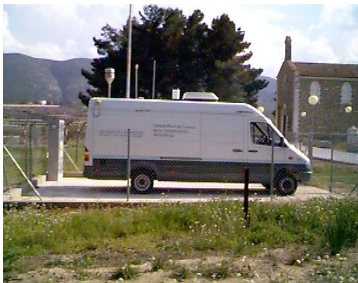
Foto: Unitat mòbil a ONTINYENT.

La Xarxa Valenciana de Vigilància i Control de la Contaminació Atmosfèrica compta amb tres unitats mòbils i una Unitat d'Intervenció Ràpida, les quals, obtenen informació sobre nou emplaçaments repartits en l'àrea interior de la Comunitat Valenciana.