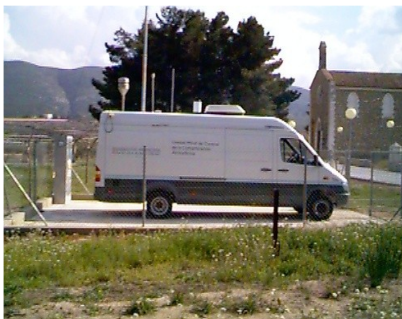
Foto: Unidad móvil en Ontinyent

La Red Valenciana de Vigilancia y Control de la Contaminación Atmosférica cuenta con tres unidades móviles y una Unidad de Intervención Rápida, las cuales, obtienen información sobre 9 emplazamientos repartidos en el área interior de la Comunidad Valenciana.