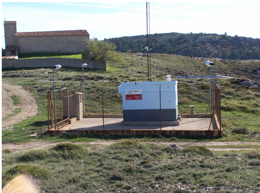
Foto: Estación de CORATXAR

En algunas estaciones se dispone además de sensores para diferentes parámetros meteorológicos, como velocidad y dirección del viento, humedad relativa, radiación solar, presión atmosférica y precipitación. Estos parámetros son útiles para la interpretación de los datos y el conocimiento de la dinámica de los contaminantes en el seno de la atmósfera.