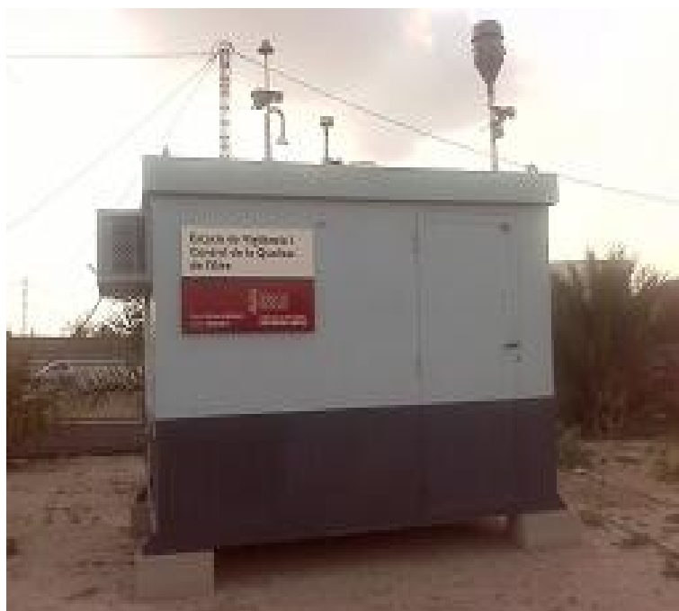
Foto: Estación de ELX-PARC DE BOMBERS

En algunas estaciones se dispone además de sensores para diferentes parámetros meteorológicos, como velocidad y dirección del viento, humedad relativa, radiación solar, presión atmosférica y precipitación. Estos parámetros son útiles para la interpretación de los datos y el conocimiento de la dinámica de los contaminantes en el seno de la atmósfera.