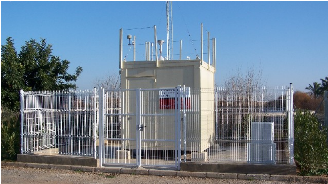
Foto: Estación de SAGUNT-CEA

En algunas estaciones se dispone además de sensores para diferentes parámetros meteorológicos, como velocidad y dirección del viento, humedad relativa, radiación solar, presión atmosférica y precipitación. Estos parámetros son útiles para la interpretación de los datos y el conocimiento de la dinámica de los contaminantes en el seno de la atmósfera.