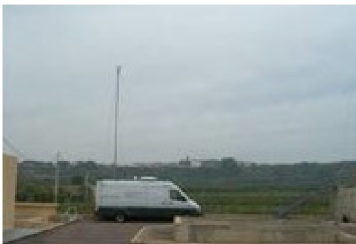
Foto: Unidad Móvil de Ontinyent

La Red Valenciana de Vigilancia y Control de la Contaminación Atmosférica cuenta con tres unidades móviles y una Unidad de Intervención Rápida, las cuales, obtienen información sobre 11 emplazamientos repartidos en el área interior de la Comunidad Valenciana.