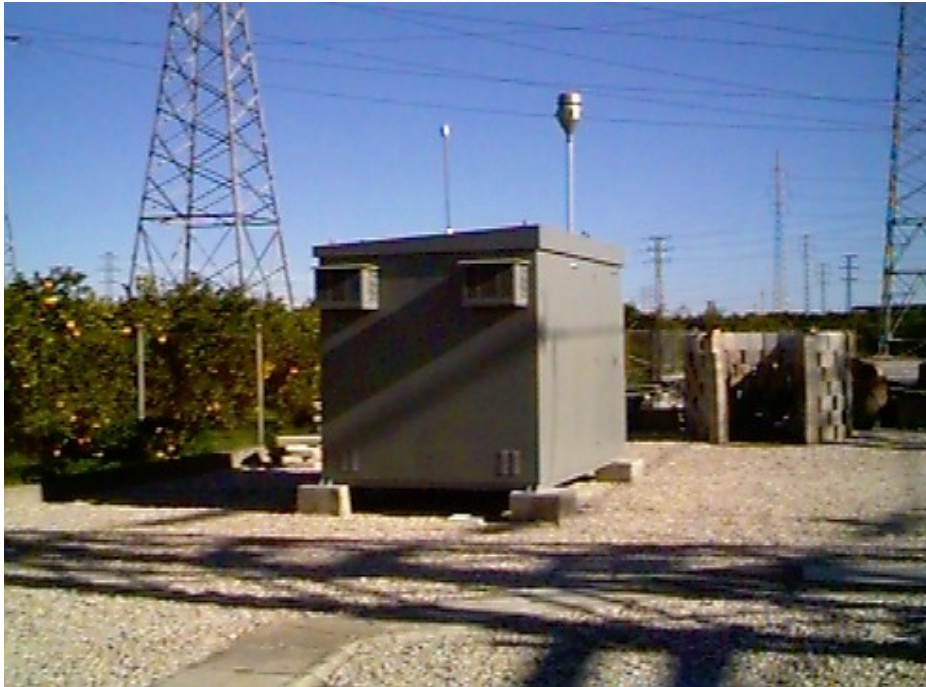
Foto: Estación de ALZIRA

También se lleva a cabo el análisis de metales como el Arsénico, Níquel, Cadmio y Plomo en la fracción PM 10 , así como del benzo(a)pireno y otros hidrocarburos aromáticos policíclicos.