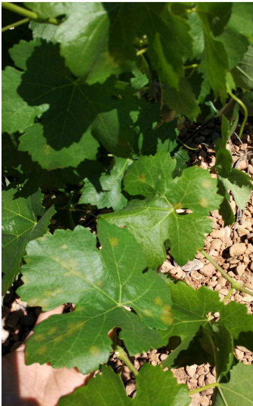
Taques d'oli en fulla

Es recorda la importància de respectar les dosis que apareguen en l'etiqueta del fungicida, així com utilitzar maquinària adequada que ens assegure un perfecte mullat de totes les parts verdes de la planta.