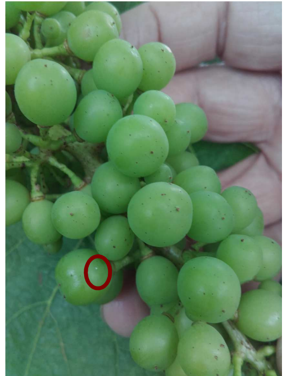
Huevo de polilla recién puesto sobre racimo

Del 8 al 12 de julio, ambos inclusive en Fontanars dels Alforins.