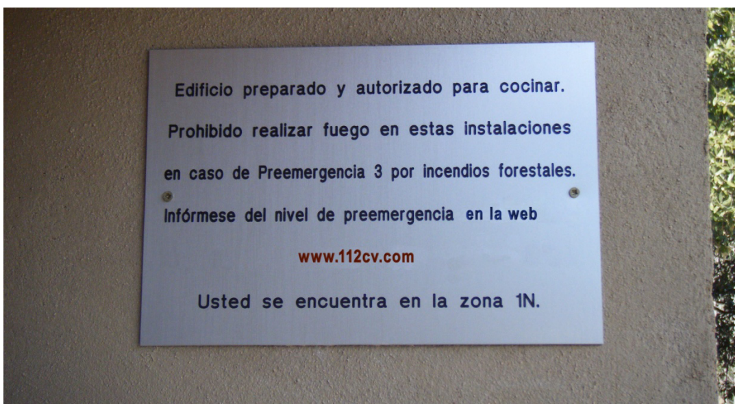
Foto 1. Ejemplo de cartelería.

Este texto se colocará en una placa o similar, en un lugar visible del paellero.