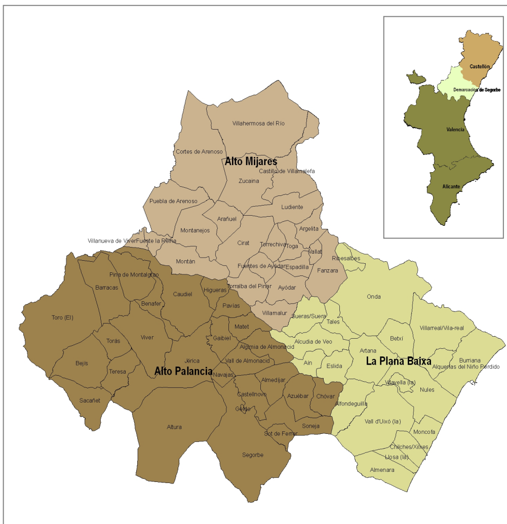
Figura 1. Localización de la Demarcación de Segorbe. Comarcas que la componen.

Demográficamente la demarcación se divide en dos partes diferenciadas, la zona litoral mucho más poblada con 298,7 habitantes/km 2 en La Plana Baixa y la zona interior poco poblada, con 6,1 habitantes/km 2 en El Alto Mijares. La comarca de El Alto Palancia queda como la comarca intermedia entre las otras dos con 24 habitantes/km 2 . Con estos extremos, la densidad de población de la demarcación en general es de 93,5 habitantes/km 2 , por encima de los 84,3 habitantes/km 2 que presenta la provincia de Castellón. La densidad demográfica de la Comunitat Valenciana es de 192 habitantes/km 2 .