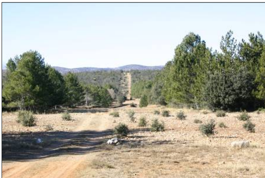
Figura 2. Plantación trufera joven localizada en un enclave del monte, junto a un cortafuegos. Las labores culturales propias de la truficultura mantienen en la parcela una estructura favorable para la prevención de incendios.

La plantación de truferas en cultivos abandonados contribuye a mantener dicha superficie con una estructura de vegetación más resistente al inicio y a la propagación de los incendios forestales que la vegetación que colonizará y evolucionará naturalmente en la zona cuyo cultivo se haya abandonado. Para recuperar estos cultivos, es recomendable eliminar toda la vegetación excepto los Quercus, hasta dejar como máximo una FCC del 10%.