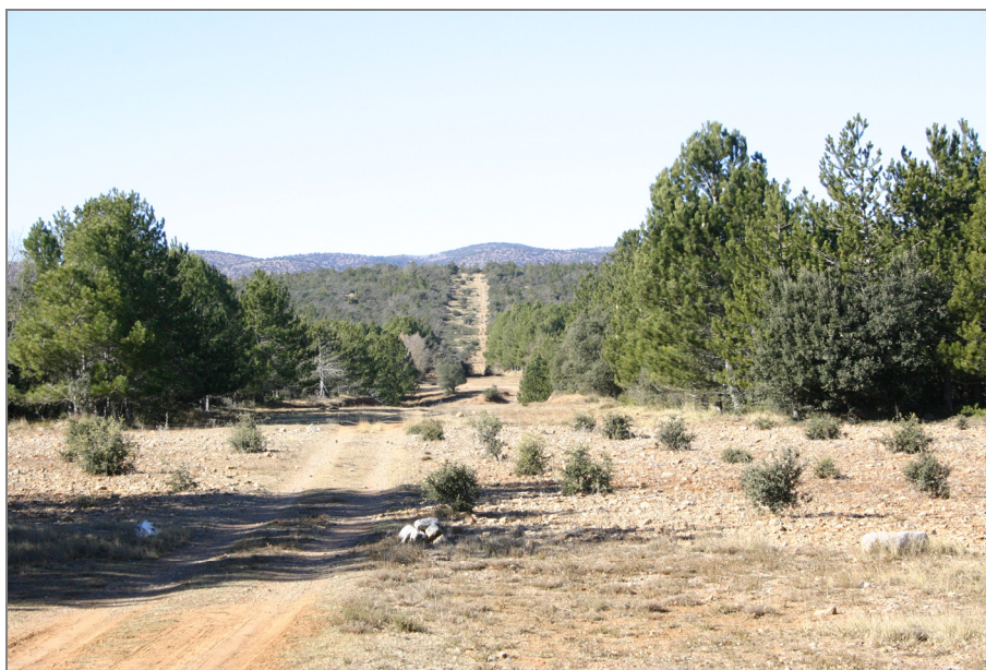
Figura 2. Plantación trufera joven localizada en un enclave del monte, junto a un cortafuegos. Las labores culturales propias de la truficultura mantienen en la parcela una estructura favorable para la prevención de incendios.

La plantación de truferas en cultivos abandonados contribuye a mantener dicha superficie con una estructura de vegetación más resistente al inicio y a la propagación de los incendios forestales que la vegetación que colonizará y evolucionará naturalmente en la zona cuyo cultivo se haya abandonado. Para recuperar estos cultivos, es recomendable eliminar toda la vegetación excepto los Quercus, hasta dejar como máximo una FCC del 10%.