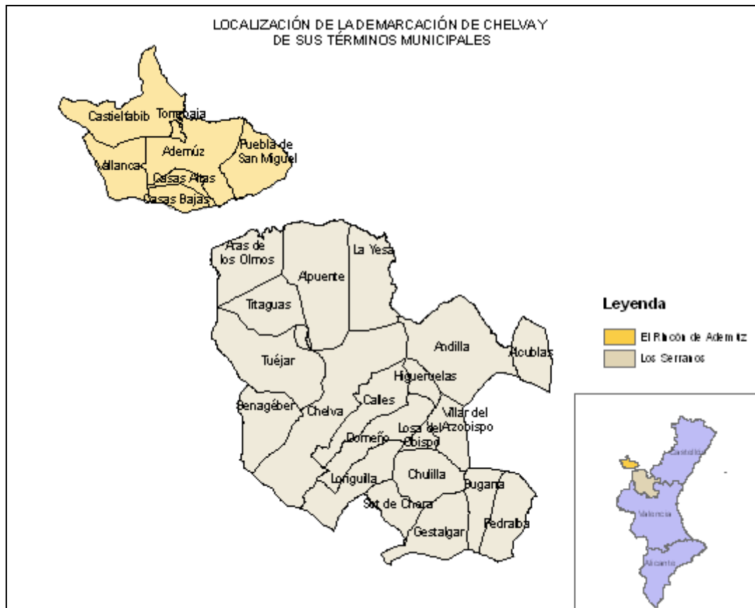
Figura 1. Localización de la demarcación de Chelva, de sus comarcas y municipios.

La demarcación está poco poblada; la densidad de población es de 109 habitantes/km 2 , muy por debajo de los 228 habitantes/km 2 que presenta la provincia de Valencia y de los 192 habitantes/km 2 de la Comunitat Valenciana.